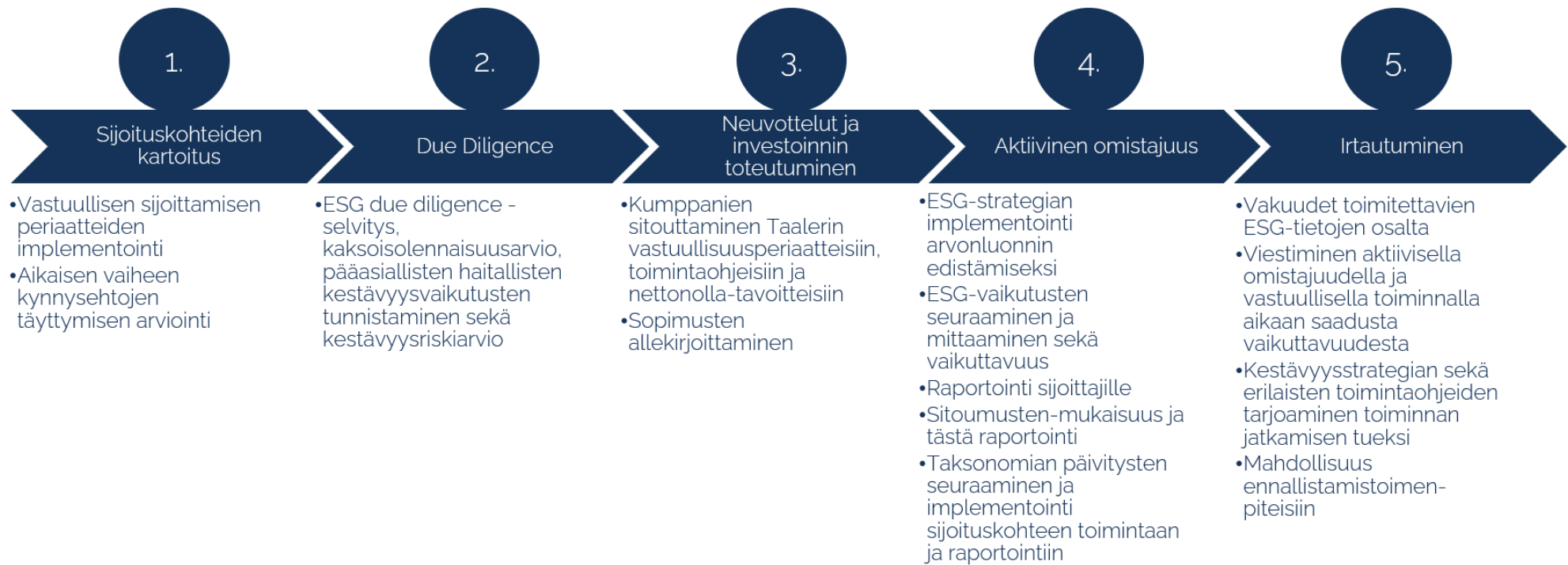
Kuva 1. Vastuullisuus osana investointiprosessia ja sijoituspäätöstä