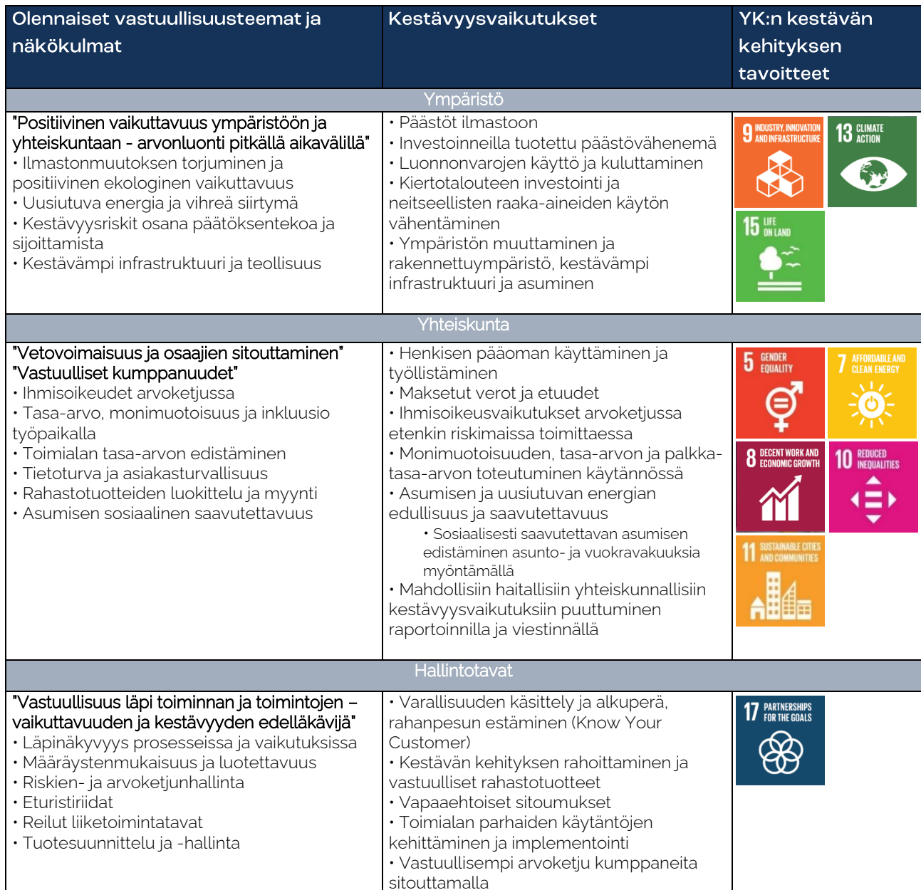
Taulukko 1. Taalerin olennaiset aiheet ja vastuullisuustyön fokus.