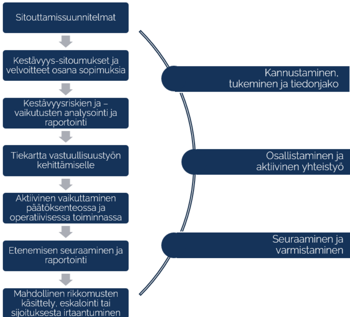
Kuva 2. Aktiivisen omistajuuden toimenpiteitä

Käytännössä aktiivista omistajuutta toteuttavat Taalerin liiketoiminnot, joita tukee vastuullisuusasioissa konsernin ESG-tiimi. Sitouttamis- ja toimintasuunnitelmien työstämisessä mukana ovat sijoitustoiminnasta sekä rahastonhoidosta vastaavat asiantuntijat, analyytikot sekä vastuullisuusasiantuntijat.